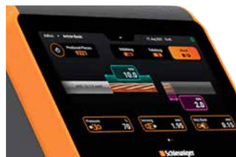
Display 5" touch screen a colori

Importante: raccomandiamo di inviare i campioni con le applicazioni richieste per un esame preventivo.