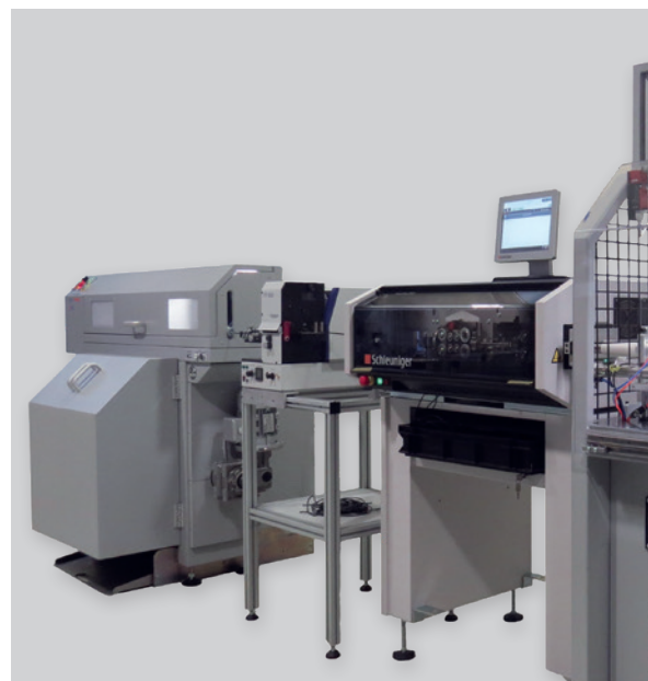
Fully equipped processing line Linea di lavorazione completa

Note: we recommend to submit wire samples with the application required for preliminary examination