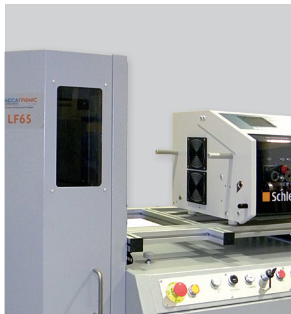
Compact processing line Linea di lavorazione compatta

Note: we recommend to submit wire samples with the application required for preliminary examination